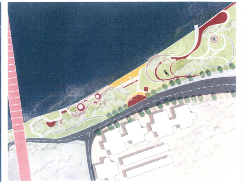
佗城遗址公园平面图