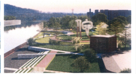
佗城遗址公园效果图